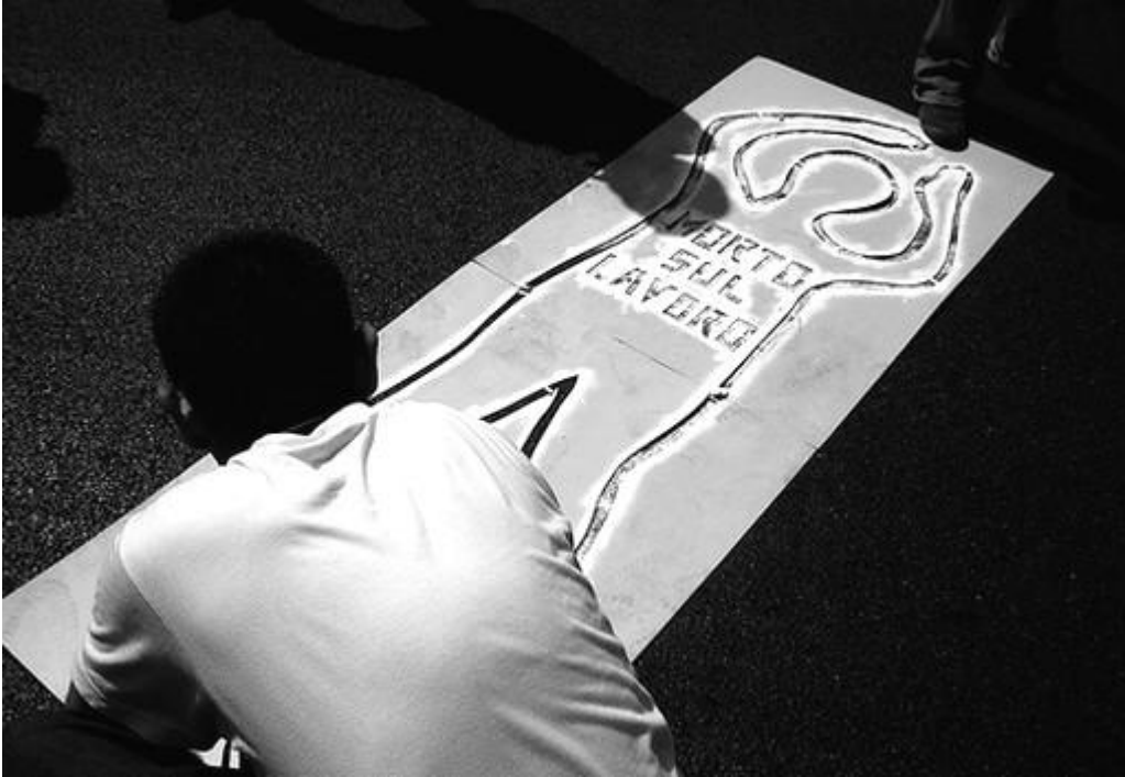
Foto scattata ai Fori Imperiali a Roma, fuori dalla Metro Colosseo, durante la manifestazione del 25 aprile. | (Foto: fuori*testa/flickr)